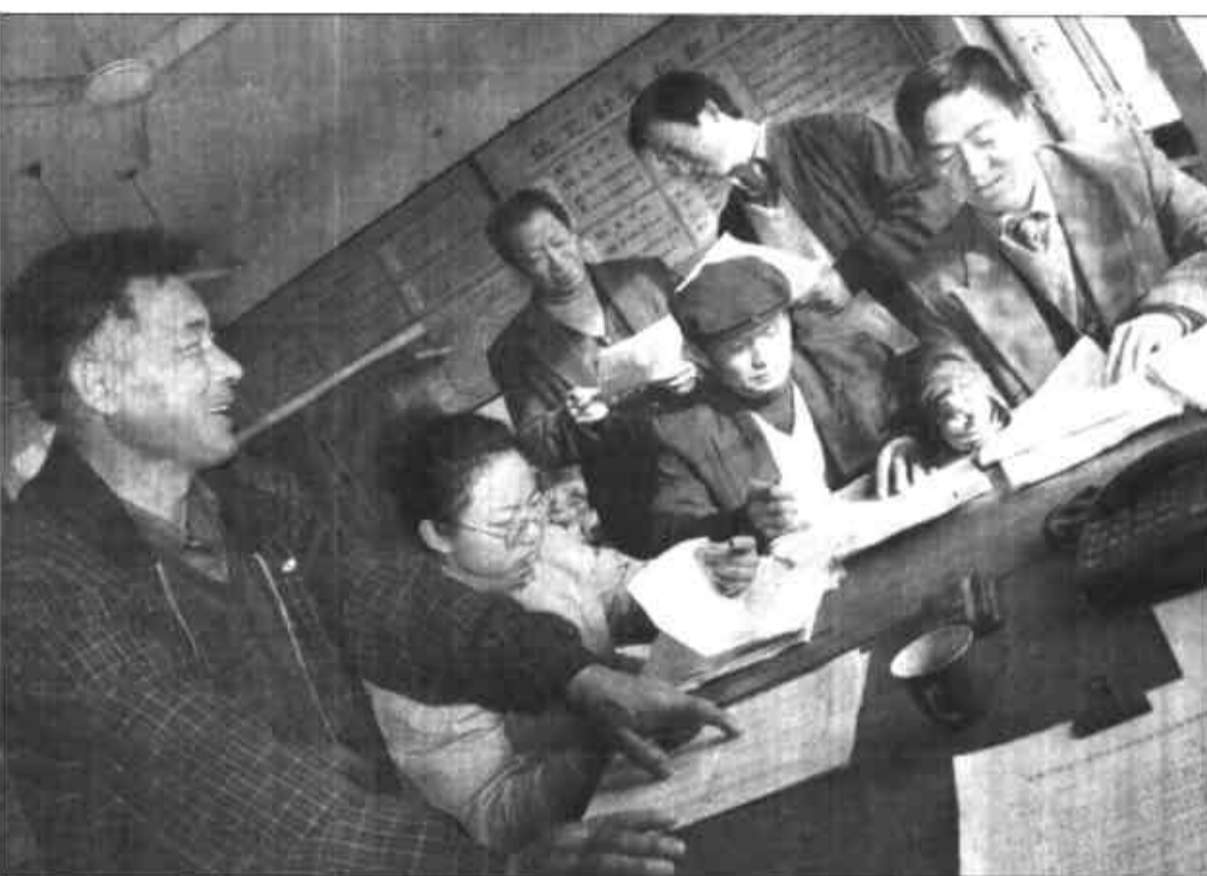
东营区史口镇团委、农技站利用冬季农闲时间开展青年科技培训工程。主要组织青年农民学习有关农村工作的政策法规及畜禽、水产、农作物科学种植、养殖技术。截至十一月三日,已有七百二十名青年农民踊跃报了名。